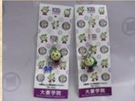
おたんストラップ