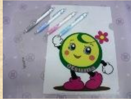
おたんクリアファイル シャープペン・ボールペン